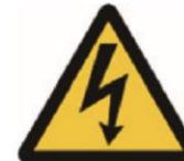
Beware of electrocution