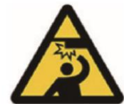
Watch your head