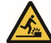
Watch your step