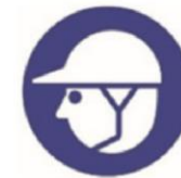
Wear protective headgear