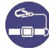
Wear your safety belt